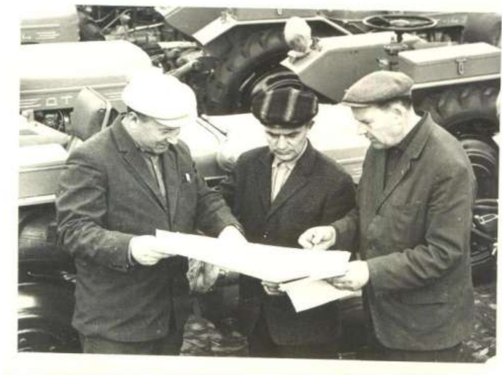
На Харьковском тракторном заводе